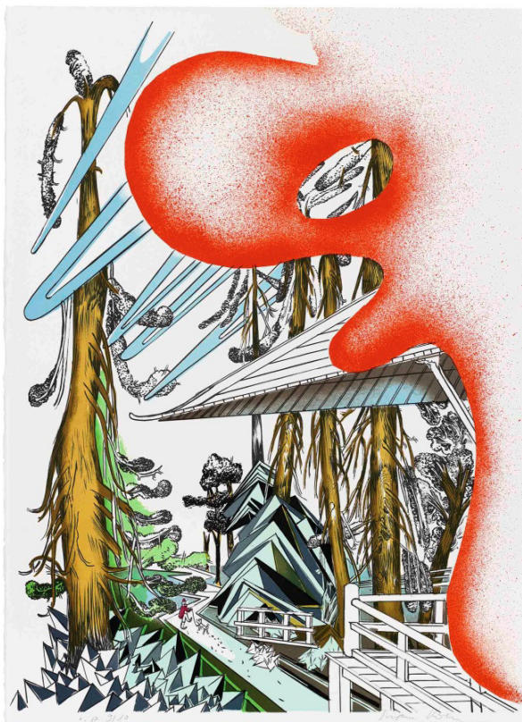
Susanne Kühn orange phantasmagoria / Oranges Trugbild, 2016 Farblithographie auf Bütten 70 x 50 cm Auflage: 100 + 10 a.p. nummeriert + signiert